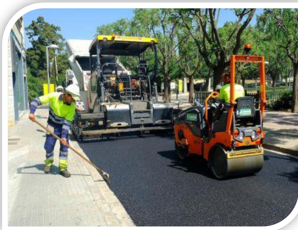
Imatge dels treballs d'asfaltat per reduir la contaminació acústica