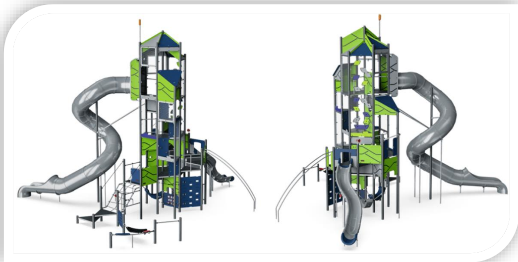
Imatge del castell que serà el joc més emblemàtic del parc Marta Mata