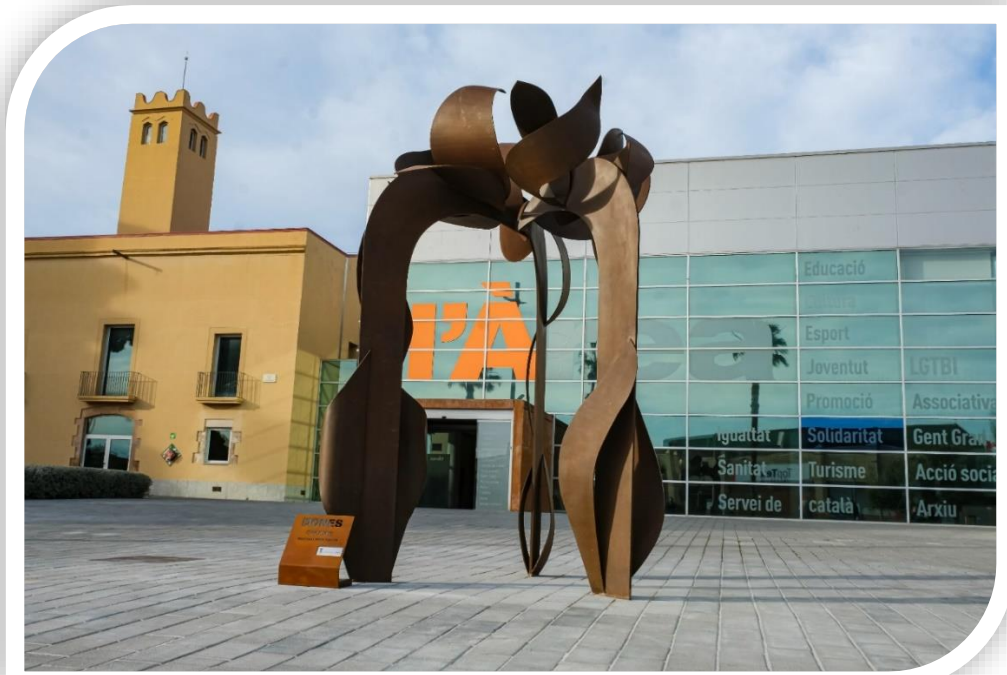
Escultura Dones a la plaça del 8 de març