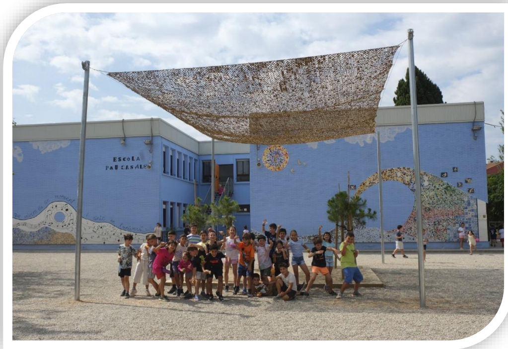
Tendalls instal·lats a l'Escola Pau Casals