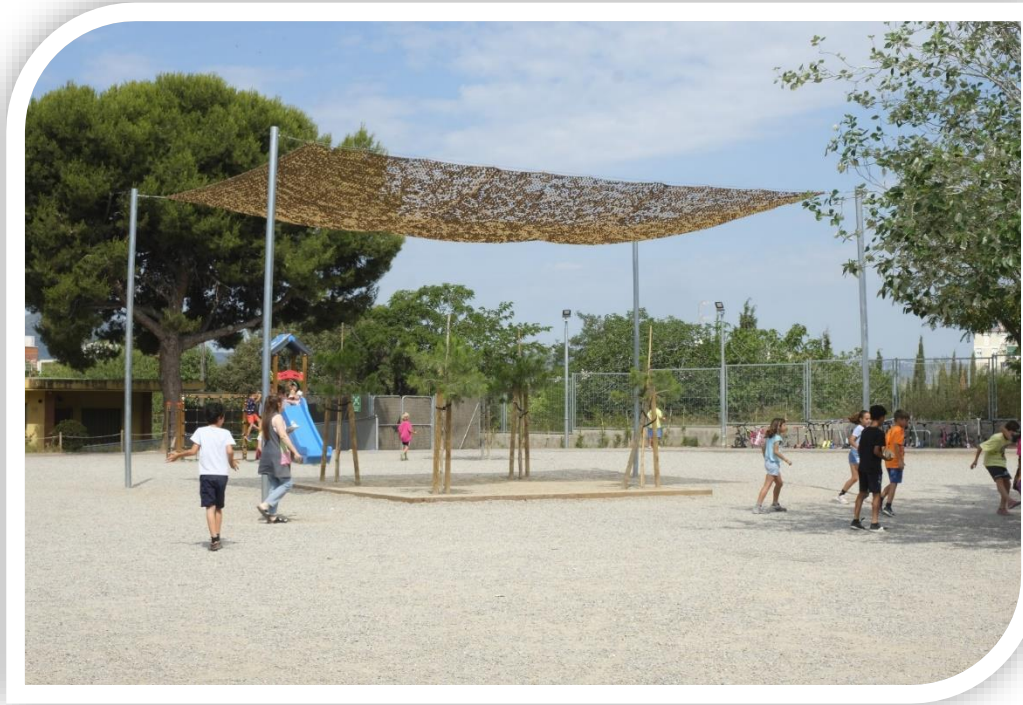
Tendalls instal·lats a l'Escola Roser Capdevila