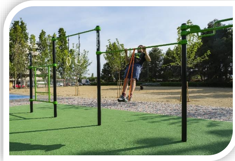
Circuit de cal·listènia al Parc del Mil·lenari