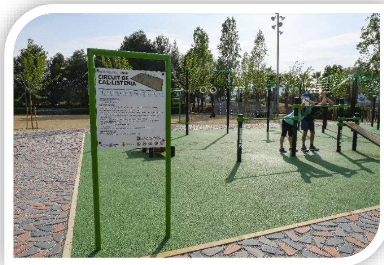
Circuit de cal·listènia al Parc del Mil·lenari