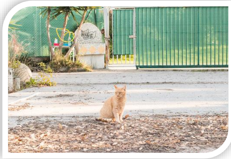
Instal·lacions de Despigat